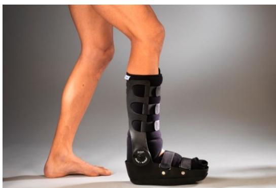
Botte de marche « Omniwalker » ®

Le groupe ALTEOR réunit 220 collaborateurs sur 5 sites de production. Constitué autour de la société Ormihl-Danet, acteur historique de l'orthopédie française d'origine lyonnaise, il associe le savoir-faire de Sober et Fag Médical, réputés pour la haute qualité de leurs orthèses, et établis sur des marchés complémentaires. Ensemble, ils proposent une offre orthopédique unifiée, de haute technicité et adaptée aux besoins et aux exigences de leurs différents publics : médecins (médecins de ville ou kinésithérapeutes), spécialistes en orthopédie et en traumatologie, pharmaciens, hôpitaux, cliniques et magasins d'orthopédie.